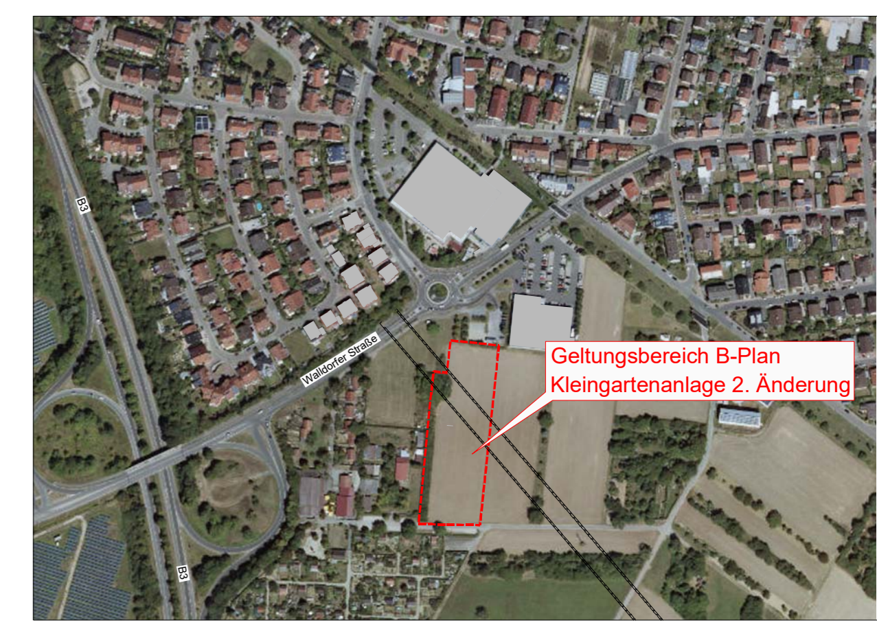
Lage im Raum, unmaßstäblich